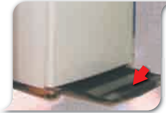
Dulang peti sejuk