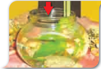
Bekas jambangan bunga