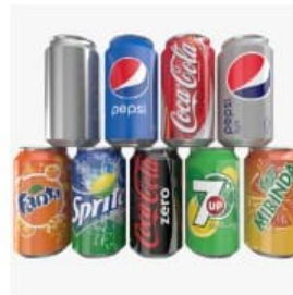
Sisa tidak organik