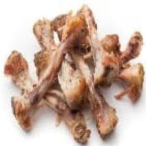
Tulang dan daging